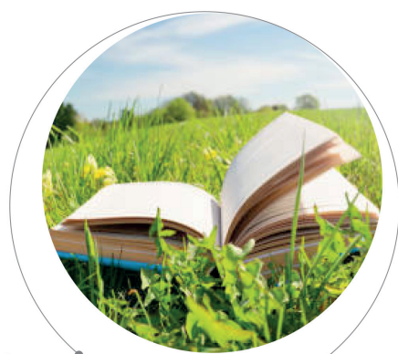
JOURNÉES DE SPÉCIALISATION