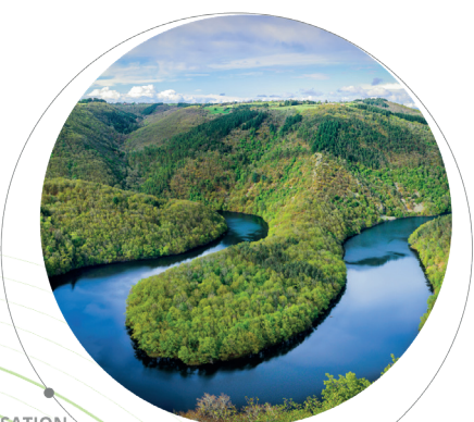
VALORISATION DES DÉCHETS

La préservation de l'environnement est une évidence pour nous et nous a conduit tout naturellement à demander et obtenir la norme ISO 14001:2015. Cette norme, une des plus strictes au monde, regroupe l'ensemble des exigences applicables à toute entreprise souhaitant confirmer son implication dans le respect de l'environnement.